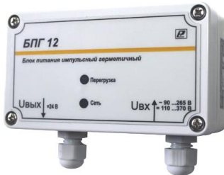
Рисунок 1 – Внешний вид блока питания импульсного герметичного БПГ 12

5.1 Подсоединение блока производить в соответствии с рисунком 1 и электрической схемой подключения (см. Приложение А).