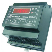
Таймер реального времени ТРВ-02