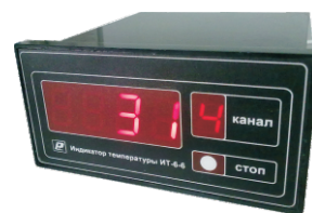
Индикатор температуры шестиканальный ИТ6-6