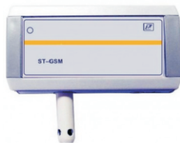
GSM-датчик температуры и протечки